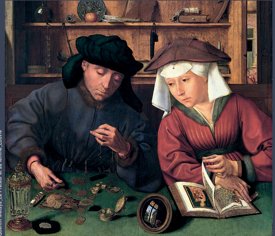
Quentin Metsys, Le Prêtre et sa femme, Louvre

Economic Reform and Social Change in the Age of Reformation